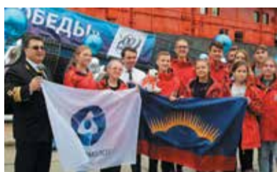
ШКОЛЬНИКИ ПОКОРИЛИ АРКТИКУ СТР. 10