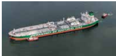
ПЕРВЫЙ В АРКТИКЕ СТР. 10

П Р И П О Д Д Е Р Ж К Е Г У М Р Ф И М Е Н И А Д М И Р А Л А С . О . М А К А Р О В А