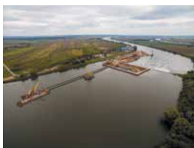
В ОЖИДАНИИ БЕЛОМУТА СТР. 8