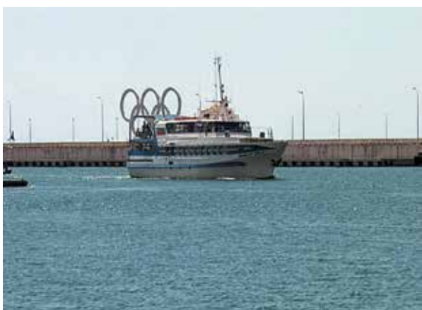
График морских прогулок включает выход в море два раза в неделю — по понедельникам и пятницам. Экскурсии, которые сопровождаются рассказом гида о достопримечательностях и знаковых местах Черноморского побережья, будут проводиться до конца сентября.

Между Туапсе и Сочи открылось морское экскурсионное сообщение на борту двухпалубного теплохода вместимостью 240 человек.